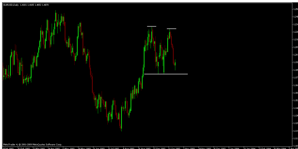
Rysunek 1. Sytuacja na parze EUR/USD

Inwestor zdawał sobie sprawę z faktu, iż formacja podwójnego szczytu dopełnia się dopiero w momencie istotnego przełamania wsparcia formacji, w tym przypadku poziomów cenowych zbliżonych do 1.18. Z tego względu, nie zdecydował się zawrzeć pozycji krótkiej, a poczekać na moment, kiedy rynek dokona wyłamania poniżej poziomu wsparcia. Aby nie ominąć okazji zajęcia pozycji po korzystnych cenach, zdecydował się zastosować zlecenia oczekujące Sell Stop o cenie aktywacji 1.1789. W momencie, kiedy kurs pary EUR/USD osiągnąłby wartość zlecenia Sell Stop, doszłoby do automatycznego zajęcia pozycji krótkiej (sell) na eurodolarze.