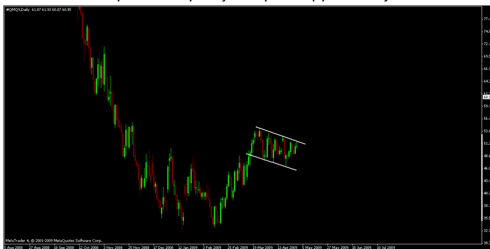
Rysunek 4. Sytuacja na rynku ropy naftowej

Formacja techniczna, która stosunkowo często występuje na wykresach cen instrumentów finansowych to formacja flagi. Formacja ta, zaliczana jest do formacji kontynuacji trendu i może kształtować się zarówno w tendencji wzrostowej, jak i spadkowej. Do formowania się flagi, dochodzi najczęściej po okresie silnego i dynamicznego ruchu cenowego, kiedy rynek zatrzymuje się w krótkim terminie, aby „złapać oddech” przed kontynuacją istniejącej tendencji. Flaga składa się z dwóch równoległych przebiegających linii ograniczających formację z góry oraz od dołu. Linia ograniczająca formację od góry – linia oporu, prowadzona jest po lokalnych maksimach trwającej konsolidacji, natomiast linia ograniczająca formację od dołu – linia wsparcia, kreślona jest po lokalnych minimach cenowych. Do wypełnienia się formacji flagi dochodzi w momencie, gdy dojdzie do wyłamania ponad górne ograniczenie formacji – w przypadku flagi w trendzie wzrostowym lub gdy będzie miało miejsce wyłamanie poniżej dolnego ograniczenia formacji – w przypadku flagi w trendzie spadkowym.