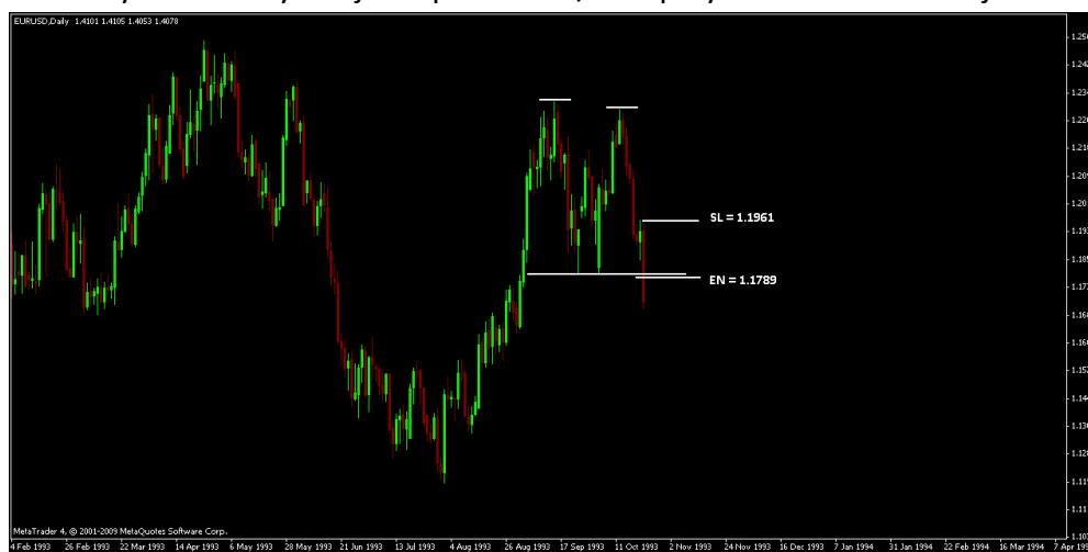
Rysunek 2. Sytuacja na parze EUR/USD przy zawarciu transakcji

Następnego dnia, na rynku eurodolara doszło do wyłamania poniżej poziomu wsparcia przy 1.18 i zlecenie sprzedaży pary EUR/USD zostało zrealizowane po kursie 1.1789. Wybicie poniżej poziomu wsparcia formacji dopełniło formujący się podwójny szczyt cenowy, przez co inwestor był w stanie oszacować potencjalny zasięg ruchu spadkowego. W większości obserwacji, realizacja formacji podwójnego szczytu prowadzi do spadków na wysokość formacji tj. punktowej odległości pomiędzy minimum formacji – wsparciem przy 1.18 oraz maksimum formacji – szczytami przy 1.2300 - 1.2320. W ten sposób odmierzając wielkość 500 - 520 pipsów od punktu przełamania poziomu wsparcia przy 1.18, inwestor oszacował poziom docelowy ruchu spadkowego do okolic 1.1280 – 1.1300. Aby zapewnić automatyczną realizację zamknięcia pozycji zyskowej zastosował zlecenie Take Profit o cenie aktywacji 1.1283. Inwestor zdawał sobie sprawę z faktu, iż może nie dojść do realizacji zakładanego przez niego scenariusza, a w celu ograniczenia potencjalnych strat na transakcji zastosował zlecenie obronne Stop Loss po cenie 1.1961