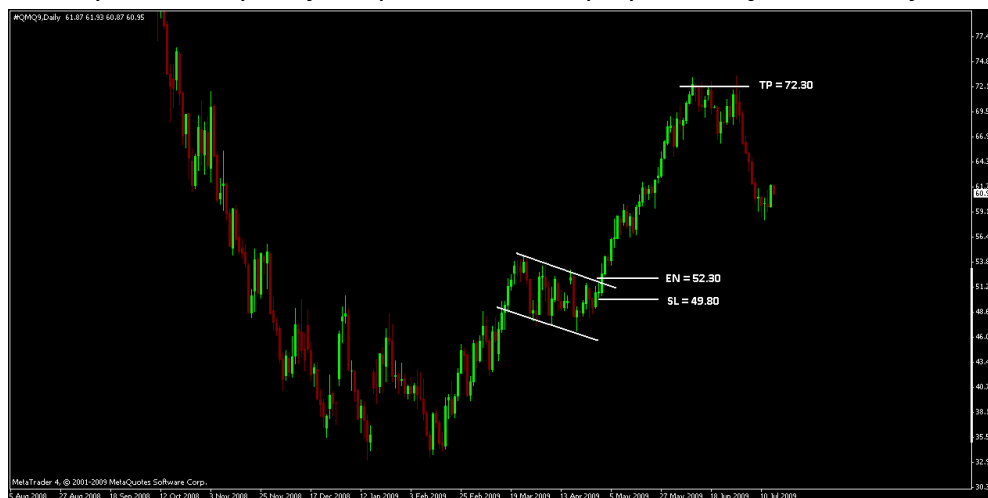
Rysunek 6. Sytuacja na parze EUR/USD przy zamknięciu transakcji

Inwestor zdecydował się zdefiniować zlecenie automatycznie zamykające zyskowną pozycję Take Profit na poziomie 72.30 USD/bbl. Jeżeli przewidywania inwestora, co do rozwoju sytuacji na rynku ropy naftowej sprawdzą się i dojdzie do realizacji zasięgu wybicia, wynikającego z formacji flagi, pozycja inwestora zostanie automatycznie zamknięta przy kursie 72.30 USD/bbl.