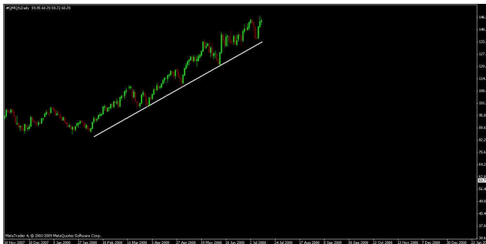
Rysunek 1. Notowania ropy naftowej w ujęciu dziennym

Założenie dotyczące przełamania linii trendu – wzrostowego czy spadkowego, może zostać wykorzystane do stworzenia systemu transakcyjnego, w którym sygnał otwarcia pozycji powstaje w momencie przełamania istniejącej linii trendu. W sytuacji, kiedy linia trendu zostaje istotnie naruszona, stwarza to możliwość zajęcia pozycji rynkowej o niskim ryzyku transakcyjnym oraz wysokiej trafności wygenerowanego sygnału. Przy takim rozwoju scenariusza rynkowego, zlecenie Stop Loss inwestora może zostać umieszczone w niewielkiej odległości powyżej linii trendu – dla tendencji wzrostowej lub poniżej linii trendu – dla tendencji spadkowej.