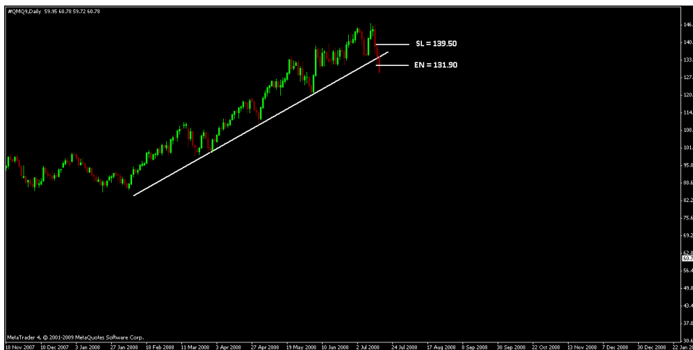
Rysunek 2. Przełamanie linii trendu wzrostowego sygnałem zajęcia pozycji krótkiej na rynku ropy naftowej

Inwestor dysponuje rachunkiem rzeczywistym w Admiral Markets Ltd. w kwocie 10 000 PLN. Postępując zgodnie z przyjętymi wcześniej zasadami zarządzania kapitałem, w jednej transakcji podejmuje ryzyko mieszczące się z zakresie <1%, 2%> wielkości kapitału na rachunku inwestycyjnym. Analiza wykresu ropy naftowej w okresie lutego – lipca 2008 roku wskazała, iż rynek znajdował się w silnej tendencji wzrostowej, którą można ograniczyć od dołu linią trendu wzrostowego. Jednakże, inwestor uważał, iż aktualna wycena baryłki ropy naftowej jest wyraźnie przewartościowana i w niedługim okresie czasu rynek ropy naftowej poddany zostanie silnej korekcie spadkowej. Podejmując racjonalne decyzje inwestycyjne zdecydował się poczekać jednak na sygnał transakcyjny, którym mogłoby być np. przełamanie istniejącej linii trendu spadkowej. Taka sytuacja miała miejsce 16 lipca 2008 roku, a inwestor podjął decyzję o zajęciu krótkiej pozycji (sell) na rynku ropy naftowej.